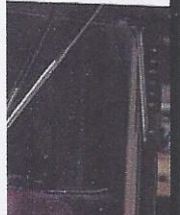
Sie färbte sich die für viele Mädchen es Magazin