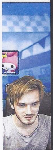
sichern (38 Mio. er 2014 fast 7 n Videobeitrag